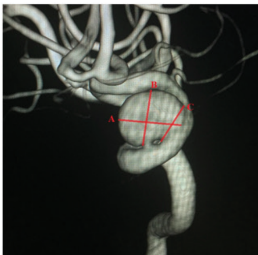
Рисунок 1 – Геометрия мешотчатой аневризмы супраклиновидного отдела правой внутренней сонной артерии (А-длина; В-ширина и С-шейка аневризмы)