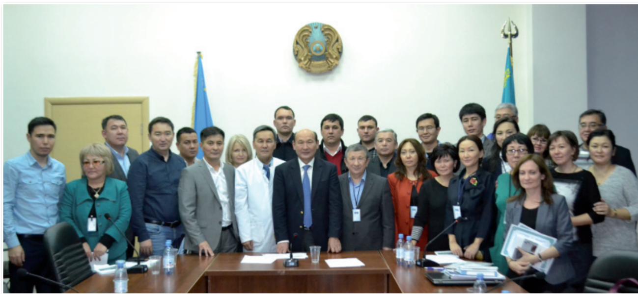
«Круглый стол» Республиканского координационного совета по проблемам инсульта

Ключевые слова: инсульт, организация, невропатология, нейрохирургия, круглый стол