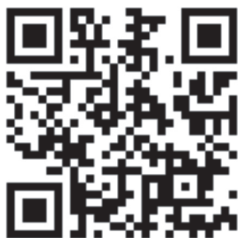
Рисунок 3 – По ссылке представлена демонстрация положения пациента на операционном столе, разрез кожи и ход операции

В послеоперационном периоде наблюдение в палате пробуждения в среднем 2 часа, далее перевод в профильное отделение и симптоматическая терапия. Средний койко-день в стационаре 7-8 суток. Во время выписки пациентам были рекомендованы контрольный осмотр через 6 месяцев и 1,5 года.