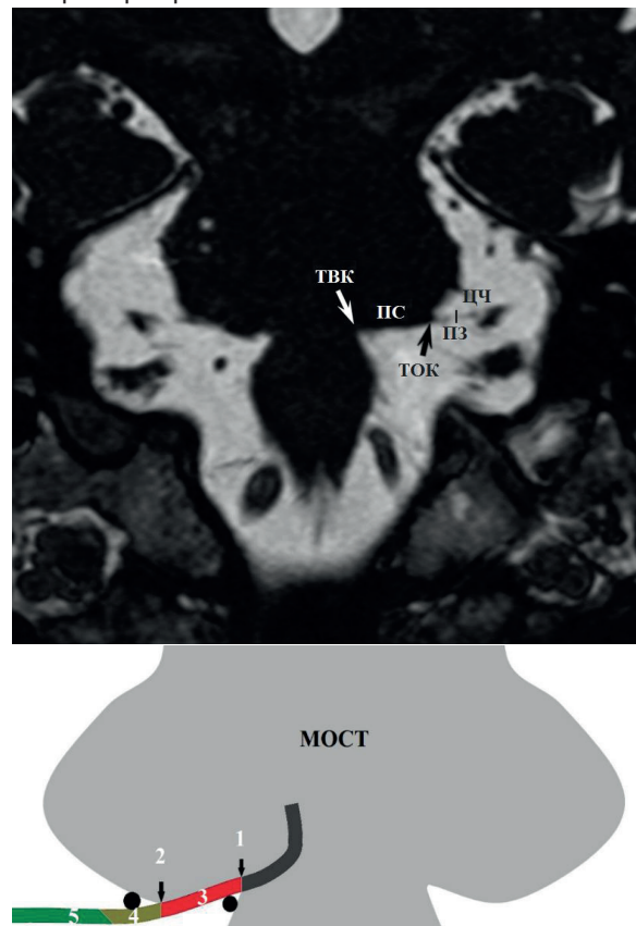
Рисунок 1 – Анатомия лицевого нерва. На фронтальном МРТ изображении, в режиме FIESTA показано предполагаемое местоположение точки выхода корешка (ТВК, белая стрелка), прикрепленного сегмента (ПС) вдоль нижней поверхности моста и точки отслоения корешка (ТОК, черная стрелка). Длина переходной зоны (ПЗ) около 3–4 мм. Цистернальная часть (ЦЧ) лицевого нерва проходит латерально по направлению к слуховому отверстию.

к вентральной поверхности моста на 8-10 мм, что называется прикрепленным сегментом. Затем он отделяется от моста в точке отслоения корешка. Следующий сегмент - это переходная зона лицевого нерва, которая представляет собой примерно 4-миллиметровый сегмент лицевого нерва, где центральный глиальный миелин переходит в периферический миелин, созданный шванновскими клетками. Размер центральной глиальной миелиновой оболочки не больше чем на 4 мм, дистальнее от точки отслоения корешка лицевого нерва. После переходной зоны цистернальная часть нерва проходит по переднебоковой части слухового отверстия. Эти анатомо-гистологические сегменты показаны на рисунке 1.