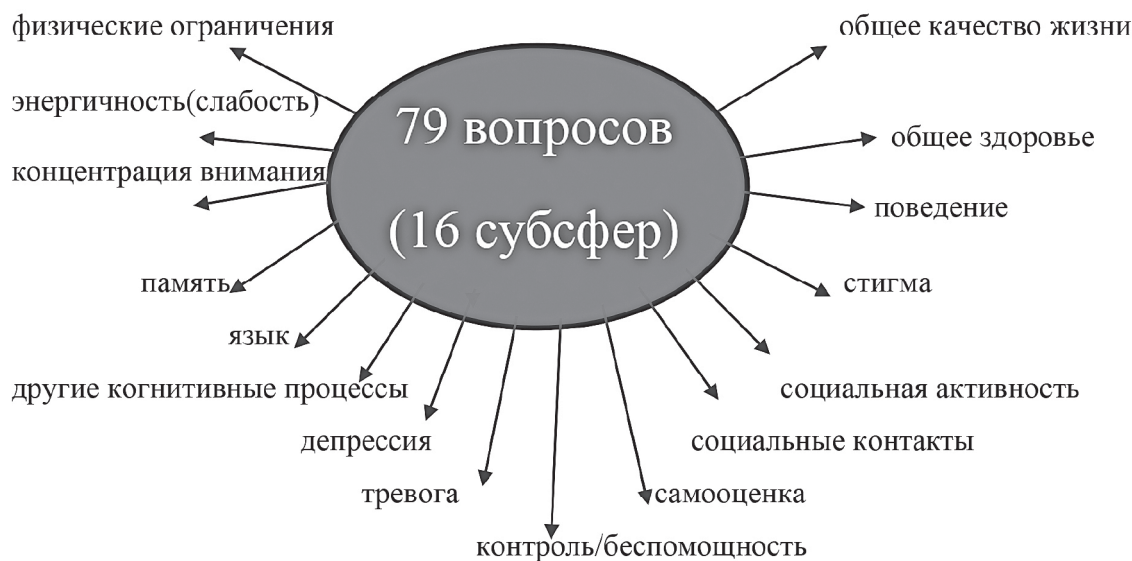
Рисунок 1 – Структура опросника для оценки качества жизни у детей с эпилепсией (Quality of Life in Childhood Epilepsy Questionnaire, сокращенно QOLCE).

Эффективность проводимого лечения оценивалась на основании изменения частоты припадков, данных повторных ЭЭГ. КЖ определялась дважды (при поступлении в стационар и через 6 месяцев после стационарного лечения).