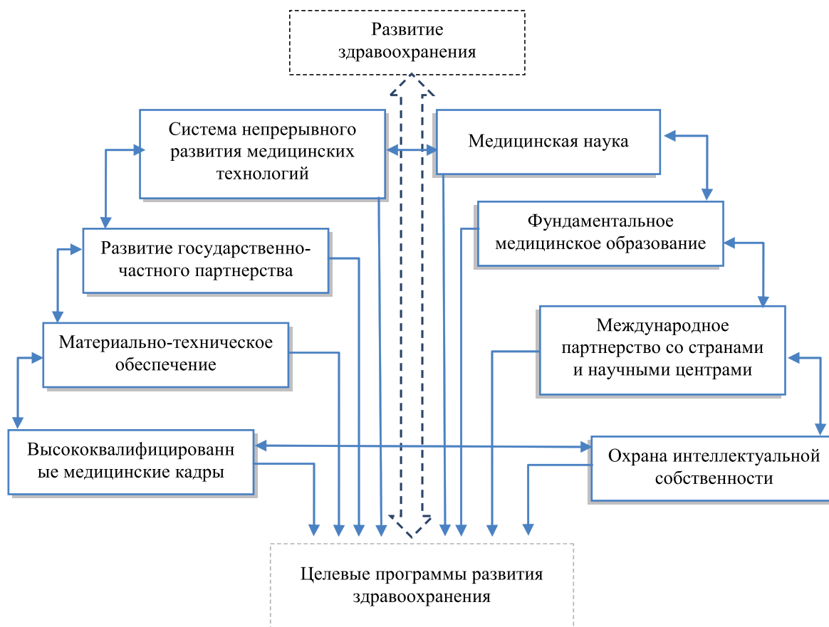
Рисунок 5 – Инструментарий инновационной модели развития здравоохранения

ненной силой и приносит производителю и/или продавцу прибыль или другую реальную выгоду. Инновационная модель развития системы здравоохранения включает в себя единство медицинской науки, развитие системы непрерывного медицинского образования, международное партнерство с ведущими странами и научными центрами, охрану интеллектуальной собственности, развитие государственно-частного партнерства, создание целевых межведомственных медицинских научных программ (Рис. 5).